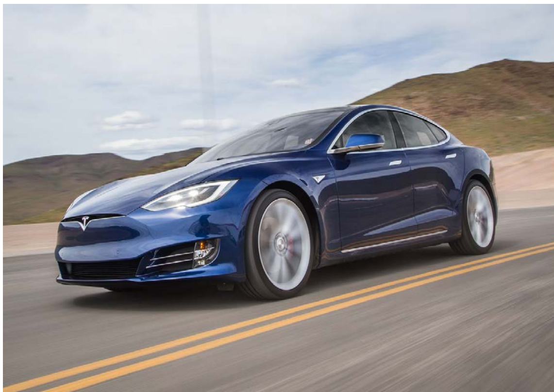
Tesla Model S: Een volledig elektrische personenauto

De datum van dit Informatie Memorandum is 21 september 2018. Indien nieuwe informatie na het uitkomen van dit Informatie Memorandum leidt tot feitelijke en materiële afwijkingen van de in dit Informatie Memorandum opgenomen uitgangspunten en aannames zal hierover zo spoedig mogelijk worden bericht.