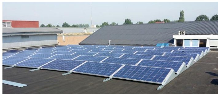
Glasservice De Wit in Breda heeft een 14,5 kW zonne-energiesysteem op het dak geïnstalleerd met een financiële lease van Volgroen