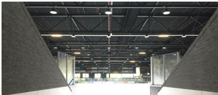
IJsschaatsbaan De Uithof in Den Haag stapte over naar betere en duurzame LED verlichting met een lease van Volgroen

206 ondernemingen kozen voor financiering van Volgroen