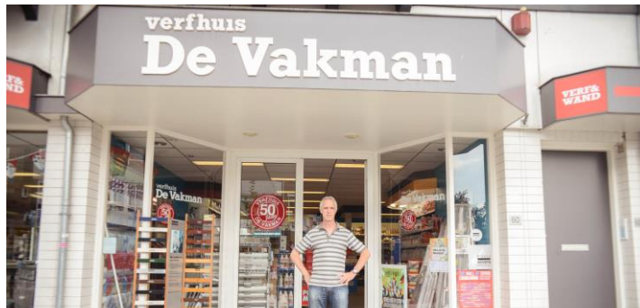
Verhuus de Vakman in Utrecht stapte over naar LED verlichting dankzij de operationele lease van Volgroen