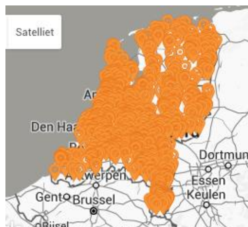
Afbeelding: Overzicht van geplaatste Zonnestroom-systemen door Zelfstroom Installaties per 1-8-2016

Onder alle klanten voert Zelfstroom structureel een klantentevredenheidsonderzoek uit. Van de huidige klanten beveelt 92% Zelfstroom aan bij vrienden, kennissen en of familie.